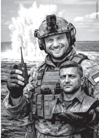
DER FALL: WER HAT HIER EIGENTLICH WEM DEN ENERGIEHAHN ZUGEDREHT?

EIN KOMMENTAR VON CHRIS BARTH ZU SPRENGSTOFF, ERPRESSUNG, SELBSTBE- TRUG UND STAATSVERSAGEN